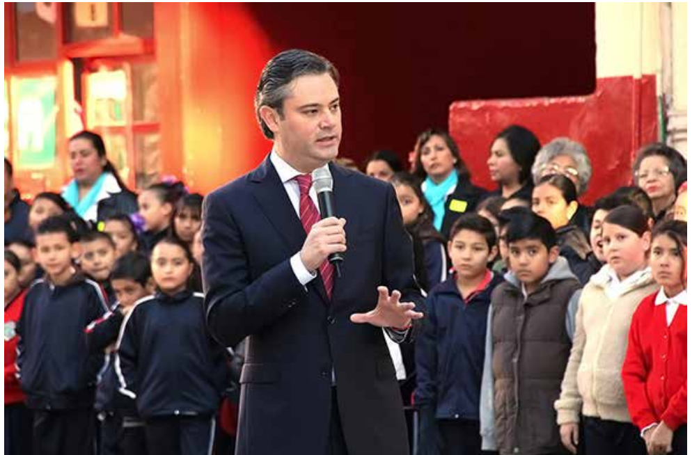
Aurelio Nuño Mayer.

Sobre los nuevos planes y programas de estudio, el funcionario sostuvo que se presentarán próxi-