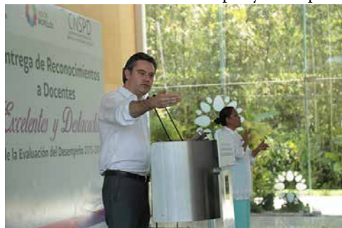
Aurelio Nuño Mayer.

Otro de los propósitos del cambio de sede es ofrecer este tipo de eventos culturales en otra zona de la Ciudad de México, atraer nuevos públicos. Dado que el Parque Bicentenario se localiza al norponiente de la capital del país, la FILIJ incidirá directamente en la población de las delegaciones Miguel Hidalgo, Azcapotzalco, Gustavo A. Madero, Cuauhtémoc y Venustiano Carranza, y en la población que se desplaza de los municipios del Estado de México como Naucalpan y Tlalnepan-