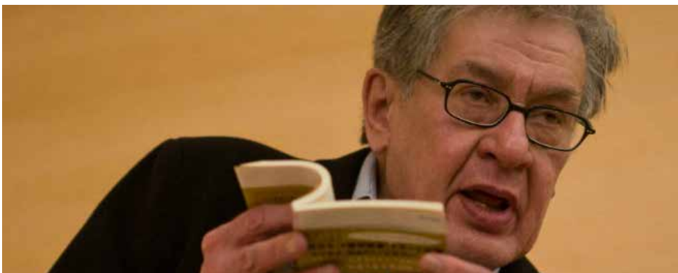
José Emilio Pacheco.

La convocatoria está dirigida a poetas de cualquier nacionalidad cuya obra esté publicada en